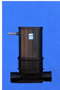
Lietevalasto säiliön ulkopuolella

Liete voidaan kerätä erilliseen säiliöön helpottamaan lietetyhjennystä.