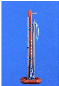
Perusversiossa ei kerätä lietettä