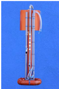
Lietevalasto säiliön sisällä