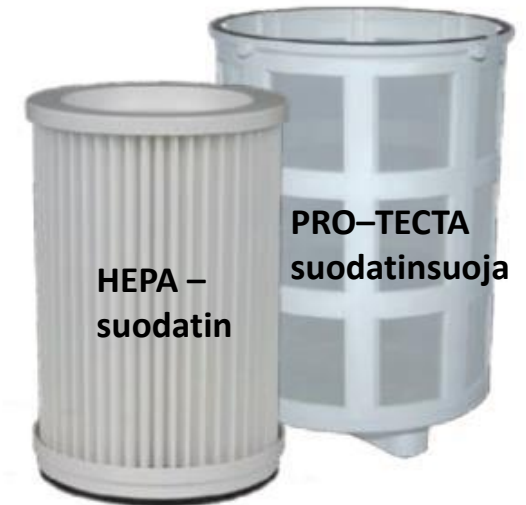
HEPA – suodatin